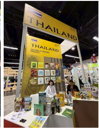
ไทย: คูหาสำนักงานส่งเสริมการค้าในต่างประเทศ ณ นครลอสแอนเจลิส