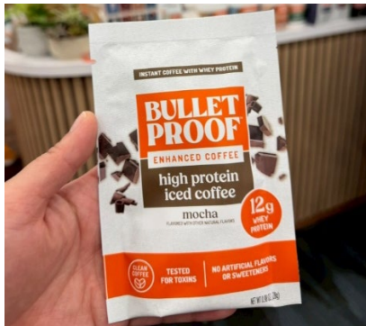
กาแฟเย็นโปรตีนสูงสำเร็จรูป