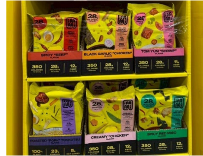
บะหมี่กึ่งสำเร็จรูปโปรตีนสูง