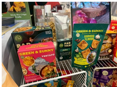
ข้าวตังรสกระเพราและแก๊วกรอบรสเย็นตาโปจากไทย