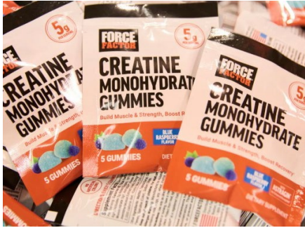
ผลิตภัณฑ์ครีเอทีน