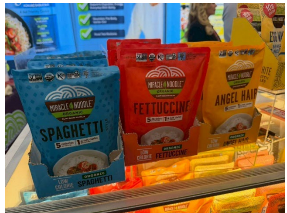
ข้าวและเส้นจากไข่ขาว