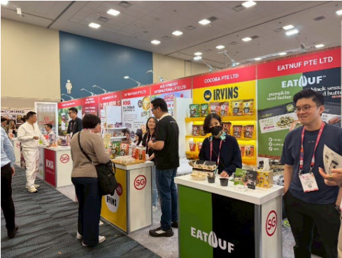
สิงคโปร์