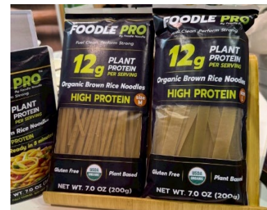
เส้นก๋วยเตี๋ยวโปรตีนสูงจากไทย