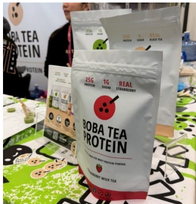
ชาวมโปรตีนสูงสำเร็จรูป