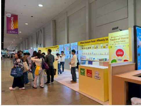
เกาหลีใต้