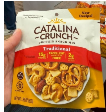
ขนมขบเคี้ยวโปรตีนสูง