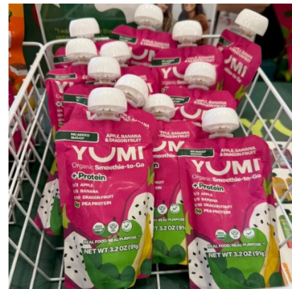
สมูทตี้ผสมโปรตีนขนาดพกพา