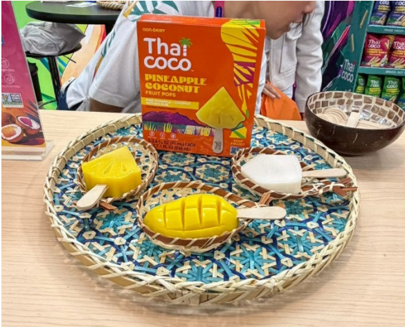
ผลไม้แช่แข็งในรูปแบบไอศกรีมแท่ง