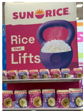
ข้าวหอมมะลิเต็มคอลลาลาเจนและโปรตีนพร้อมรับประทานจากไทย แบรนด์อเมริกัน