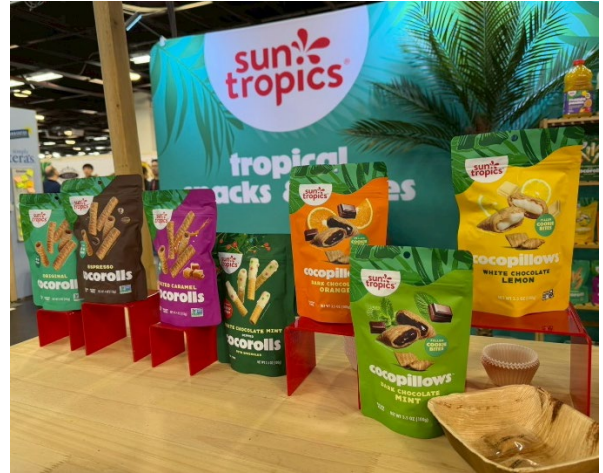
ขนมขบเคี้ยวจากไทยแบรนด์อเมริกัน