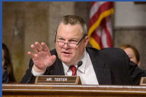
จากซูเปอร์มาร์เก็ตนั้นผลิตในสหรัฐอเมริกา อีกทั้งยังช่วยยกระดับการแข่งขันให้ตลาดกับครัวเรือนเกษตรกรและเจ้าของ ฟาร์มในมลรัฐมอนทานาอีกด้วย”