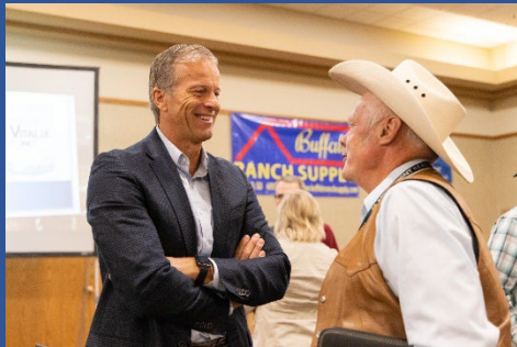
“การติดฉลากที่มีความโปร่งใสจะยังประโยชน์ให้ทั้งผู้ผลิตและผู้บริโภค” นายจอห์น ฐน วุฒิสมาชิกรัฐเซาท์ดาโคตา