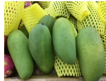
ตัวอย่างมะม่วงของเวียดนามที่ส่งออกไปยังตลาดสหรัฐฯ

ฝ่ายเกษตร ประจำสถานกงสุลใหญ่ ณ นครลอสแอนเจลิส สิงหาคม ๒๕๖๔