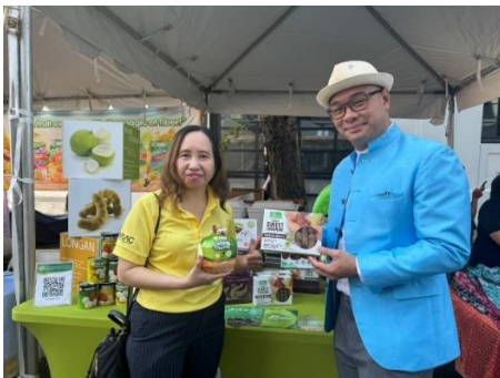
กงสุล (ฝ่ายเกษตร) และกงสุลใหญ่ ณ นครลอสแอนเจลิส