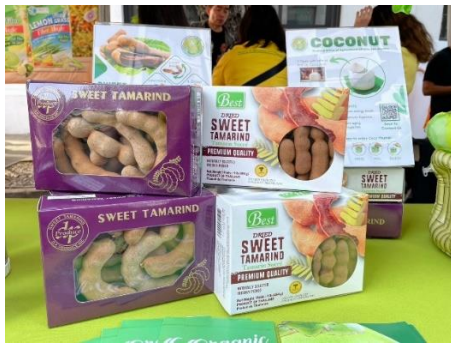
มะขามหวาน