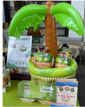
มะพร้าว Coco Thumb