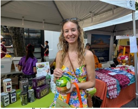
ผู้เยี่ยมชมคูหาฝ่ายเกษตรฯ