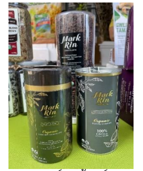
ผลิตภัณฑ์โกโก้พันธุ์ไทย