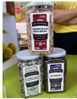
ข้าวชนิดต่างๆ