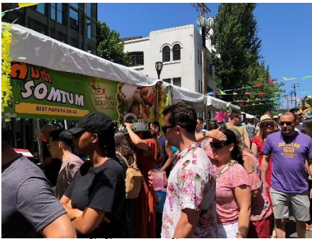
บรรยากาศผู้เข้าชมงานซื้ออาหารภายในงาน