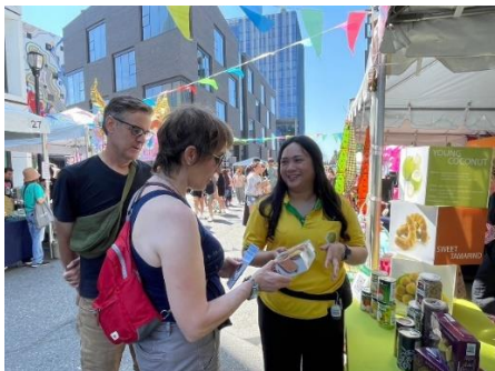
บรรยากาศคูหาฝ่ายเกษตรฯ