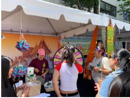
คูหา ททท. และ สคต. ลอสแอนเจลิส