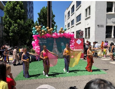
การแสดงรำไทย