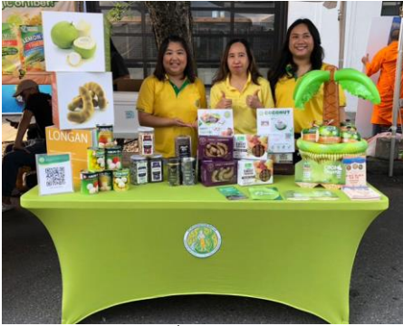
คูหาฝ่ายเกษตรฯ