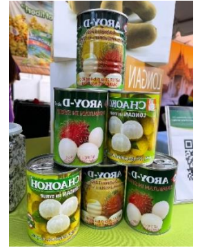
ผลไม้กระป๋อง