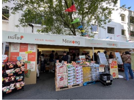
คูหารานคาแม่โขง