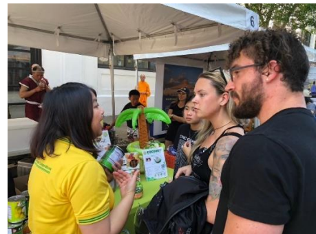
บรรยากาศคูหาฝ่ายเกษตรฯ