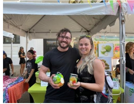
ผู้เยี่ยมชมคูหาฝ่ายเกษตรฯ