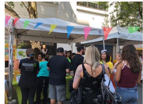
บรรยากาศคูหาฝ่ายเกษตรฯ